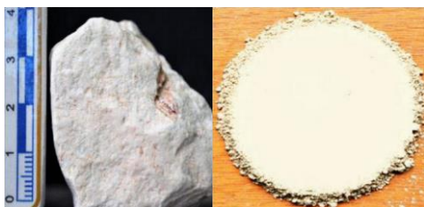
Vista Macroscópica: Estada natural - Muestra pulverizada

Color: beige grisáceo claro Características distintivas: material pulverizado, amorfo e inodoro, untuoso al tacto y bajo peso aparente. Grado de meteorización: bajo (nulo) PH en 10%: 8.87 Humedad: 2.60% pp Retención de humedad: 143.18%pp C.I.C: 32.73 meq/100grs Densidad aparente: 0.3 – 0.5 gr/cm 3 % absorción (H 2 O): 210 Máximo % de humedad: 16.63%pp Punto de fusión: 1400 °c + / - 50°c Combustibilidad: nula Conductibilidad térmica: nula Granulometría: < 38 micras Corrosividad: no corrosivo Estabilidad: muy estable, químicamente inerte Solubilidad: no soluble en agua